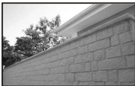
Ex.: Modelo de Pingadeira.

Esse procedimento impede a infiltração das águas de chuva entre a peça e a parede.